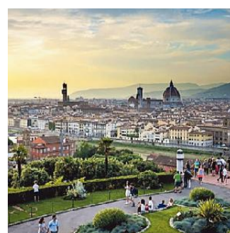
Veduta da piazzale Michelangelo