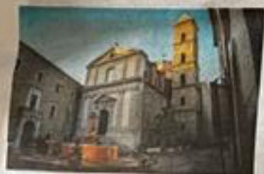
SIMBOLO Il Duomo di Potenza dedicato a San Gerardo, il patrono