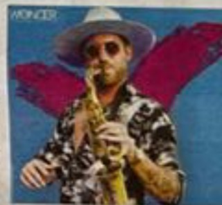
CONCERTO Nei riquadri la Cava del Sole a Matera e Jimmy Sax